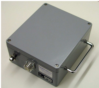
HF-Breitbandtransformator Typ UU-41-3

Wir haben eine Typenreihe von Hochfrequenzbreitbandtransformatoren für EMV-Messungen und Amateurfunkanwendungen entwickelt, die wir in unserer Werkstatt selbst herstellen.