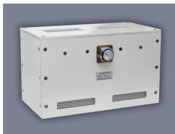
HF-Breitbandtransformator Typ UU-41-10

Wir haben eine Typenreihe von Hochfrequenzbreitbandtransformatoren für EMV-Messungen und Amateurfunkanwendungen entwickelt, die wir in unserer Werkstatt selbst herstellen.